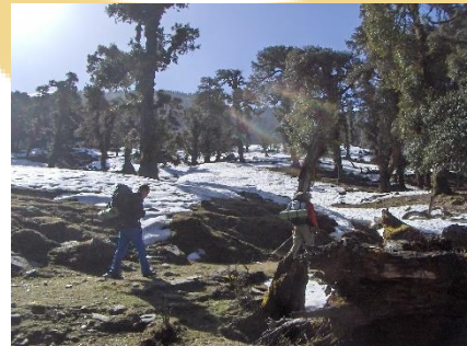
Chopta trekking 2007