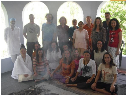
Phool Chatti Ashram 2010

Alle maaltijden, verblijf en activiteiten zijn inbegrepen.