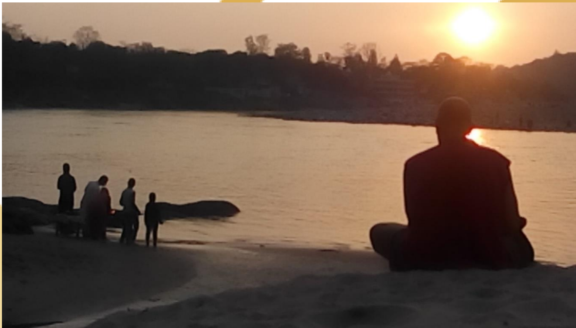
Ganga-ma, Rishikesh 2014