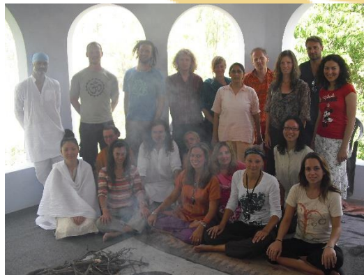
Phool Chatti Ashram 2010

Alle maaltijden, verblijf en activiteiten zijn inbegrepen.