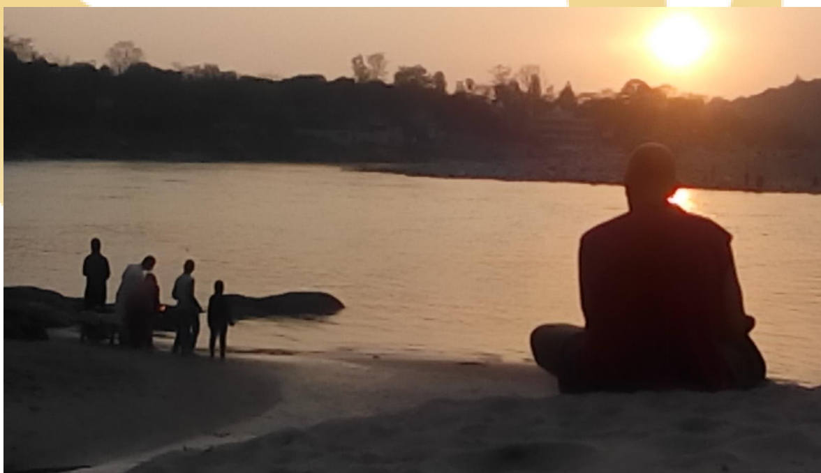
Ganga-ma, Rishikesh 2014