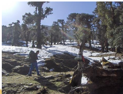
Chopta trekking 2007